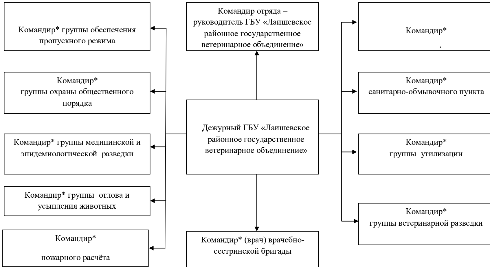
Схема оповещения командиров групп Отряда в рабочее и нерабочее время

Примечание * - командиры подразделений оповещают личный состав по своей схеме оповещения.