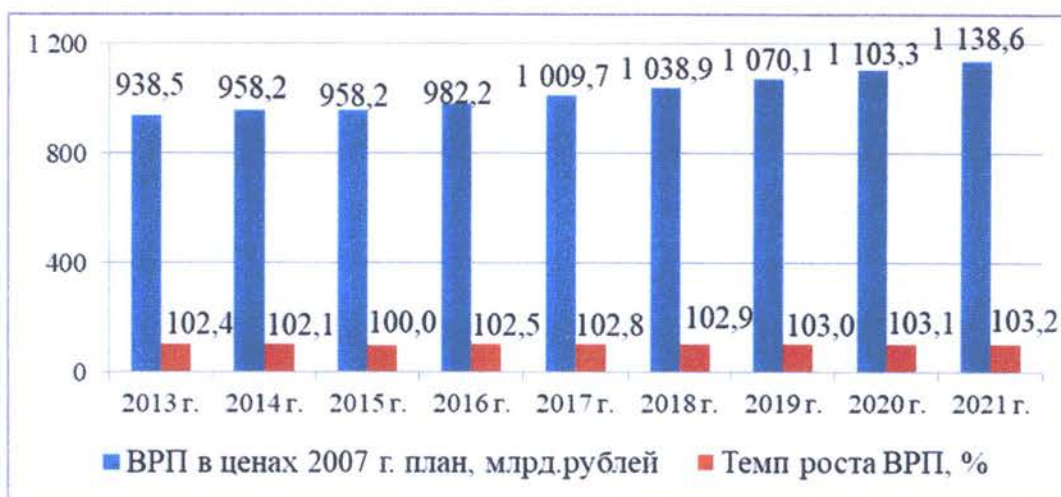
Рис. 15. Динамика и прогноз роста ВРП в ценах 2007 года (млрд.рублей)

Для снижения энергоемкости ВРП на 26,1 процента за счет реализации мероприятий Программы необходимый объем финансирования Программы составит 33 531 718,5 тыс.рублей.