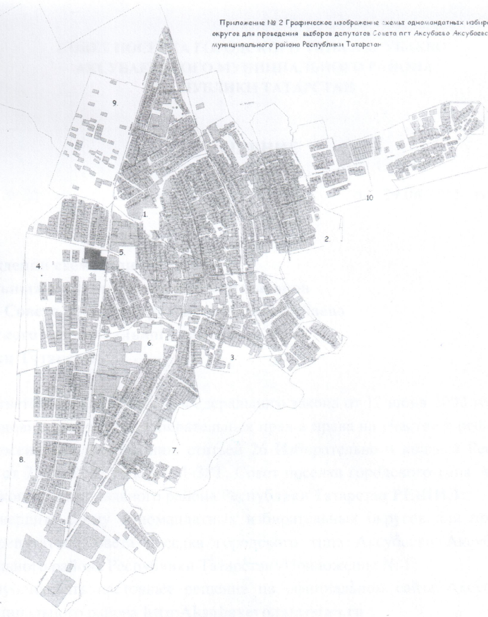
Приложение № 2 Графическое изображение схем одномандатных избирательных округов для проведения выборов депутатов Совета пгт Аксубаево Аксубаевского муниципального района Республики Татарстан

Об утверждении избирательных территориальных контуров