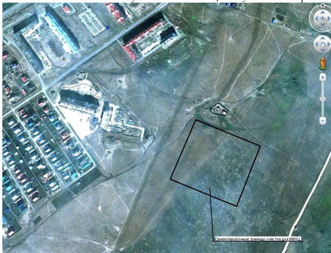
Местоположение земельного участка для МФКЦ на спутниковой карте

Выкопировка из проекта планировки Юго-восточного жилого микрорайона г. Азнакаево.