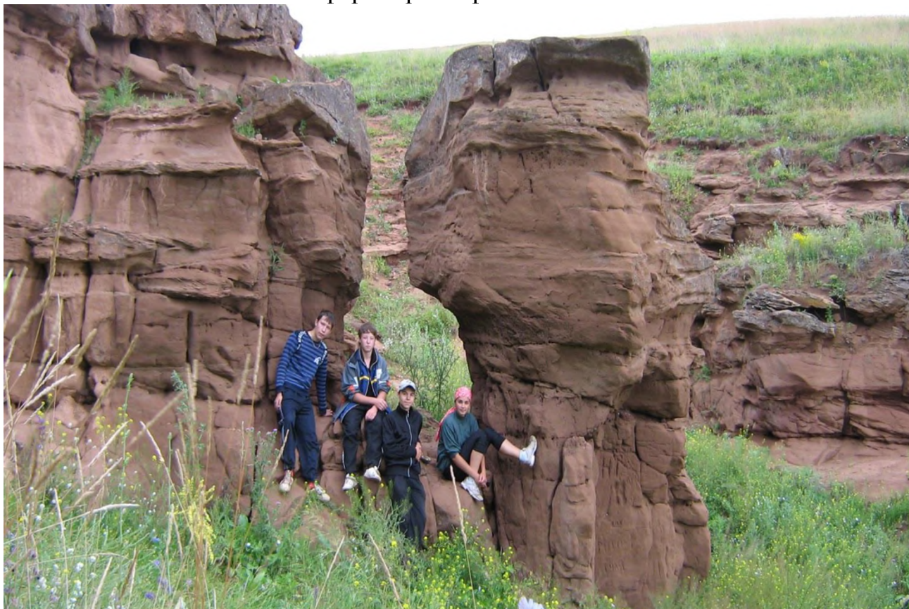
Эоловые формы рельефа возле села Алькеево.

Выходы песчаников и конгломератов возле села Алькеево созданы для занятий скалолазанием.