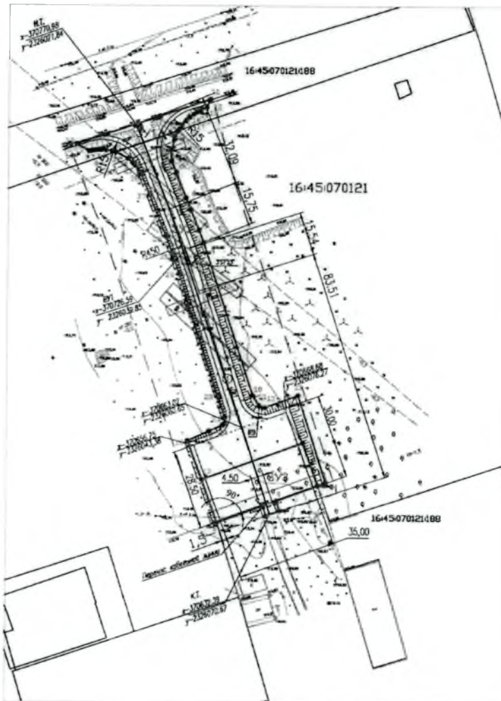
Чертеж межевания территории М 1:1000