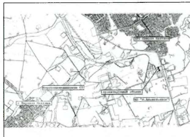
Схема размещения объекта в границах планировочной структуры территории