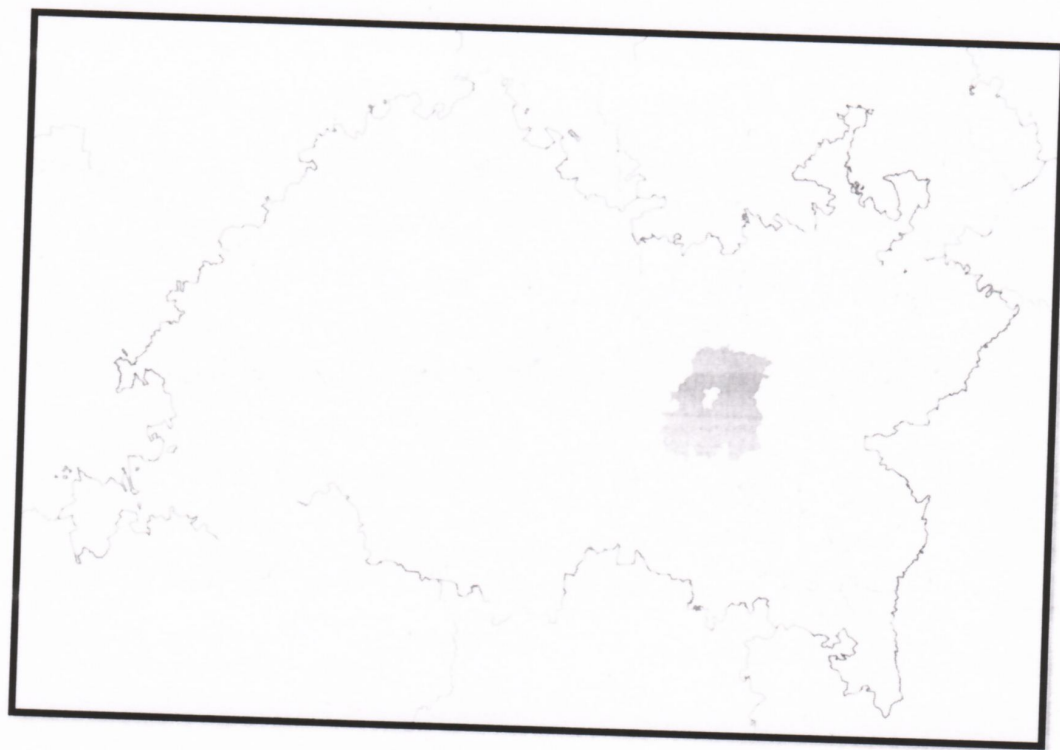
Рисунок 1 – Расположение Заинского муниципального района на территории Республики Татарстан

В Заинском районе – 1 городское и 22 сельских поселений, которые включают в себя 86 населенных пунктов – их перечень приведен в Таблице 1.